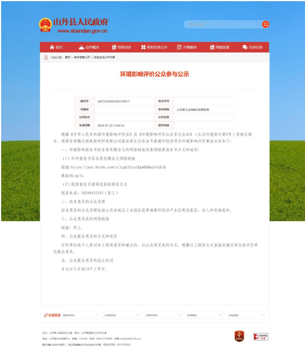
图 3-1 征求意见稿公示截图