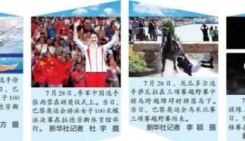
7月28日,中国选手徐嘉余在男子100米仰泳决赛中夺冠... 7月28日,中国选手徐嘉余在男子100米仰泳决赛中夺冠...