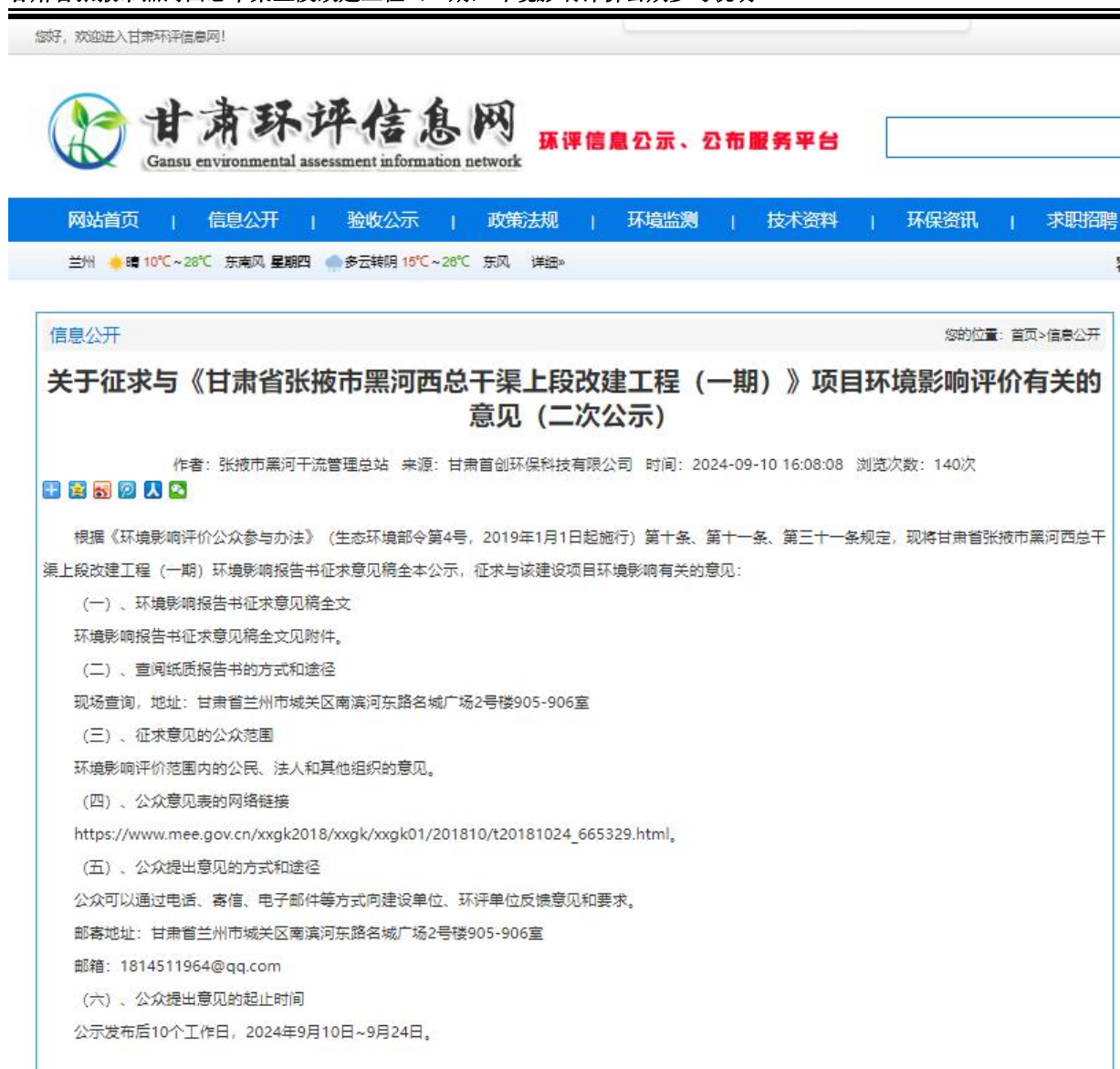
图 3-1 报告书征求意见稿公示网站截图