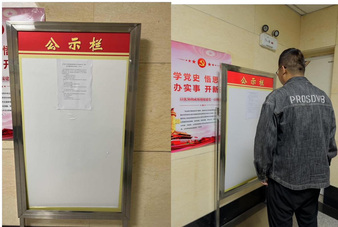
图 3-4 张贴照片

按照《环境影响评价公众参与办法》（生态环境部令第4号）的要求，我单位在网络公示期内，在项目周边对该项目信息进行了张贴公示，公开日期为2024年6月3日。