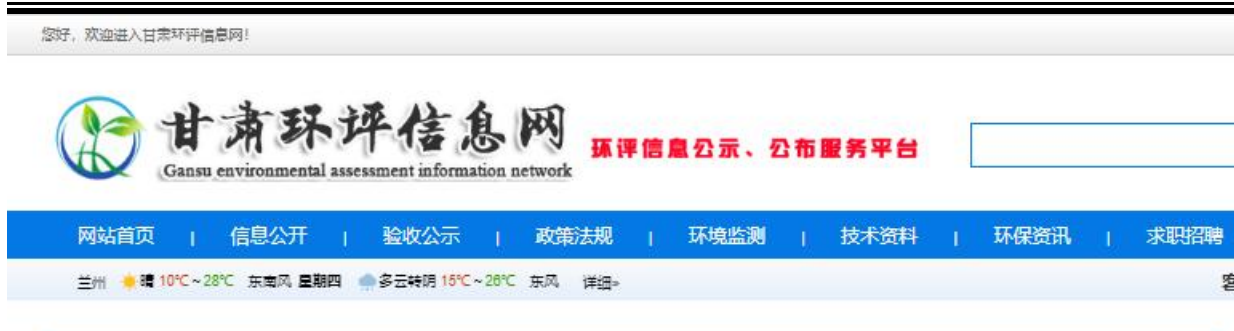
图 2-1 第一次网络公示截图